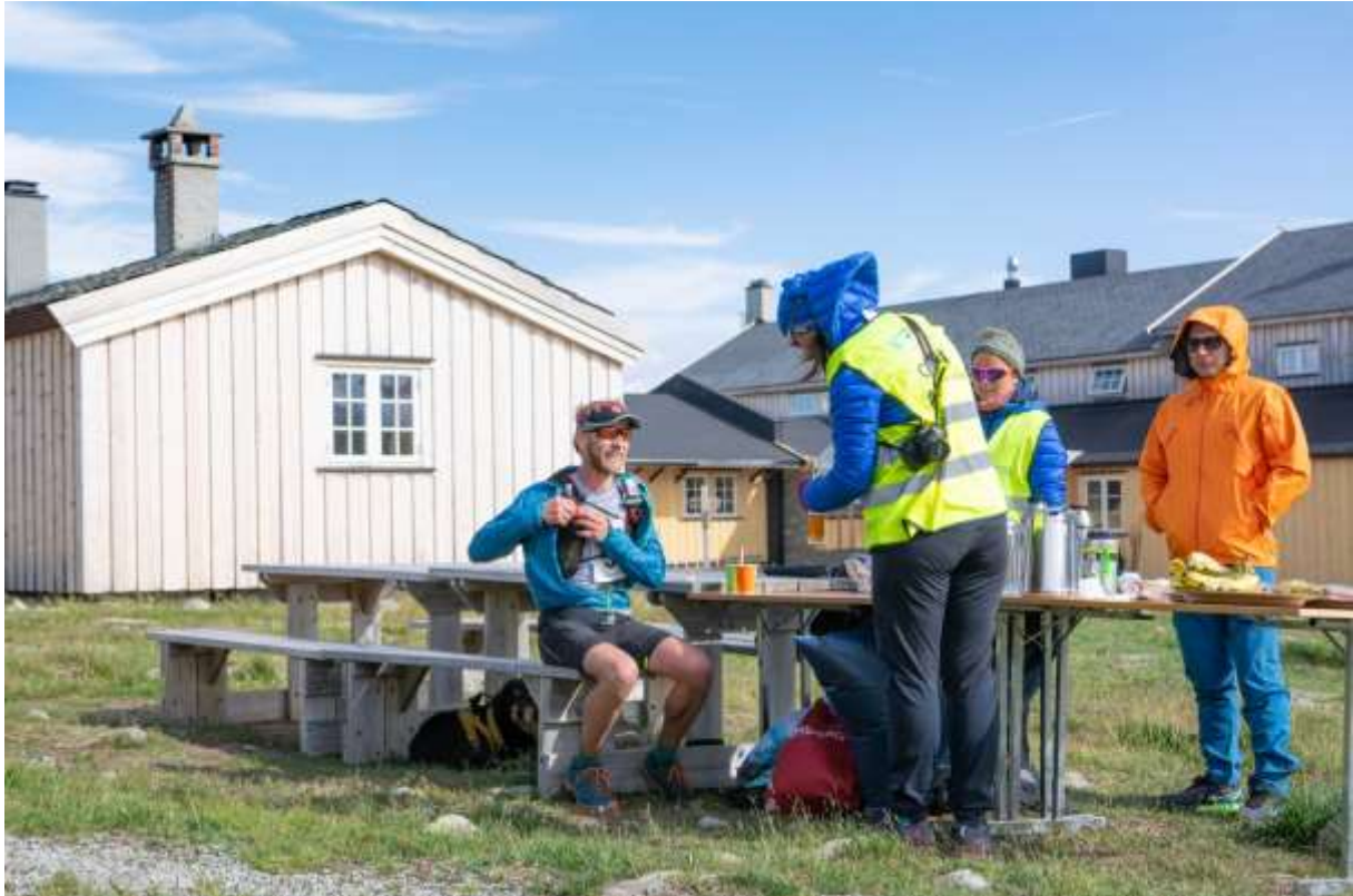
Bilde 3 Matstasjon Krækkja