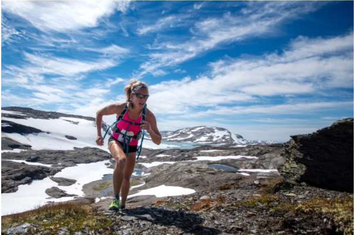
Bilde 1 Fra testløpet i 2018