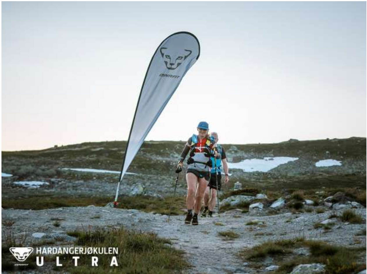
Bilde 1 Fra Dynafit Hardangerjøkulen Ultra 95k