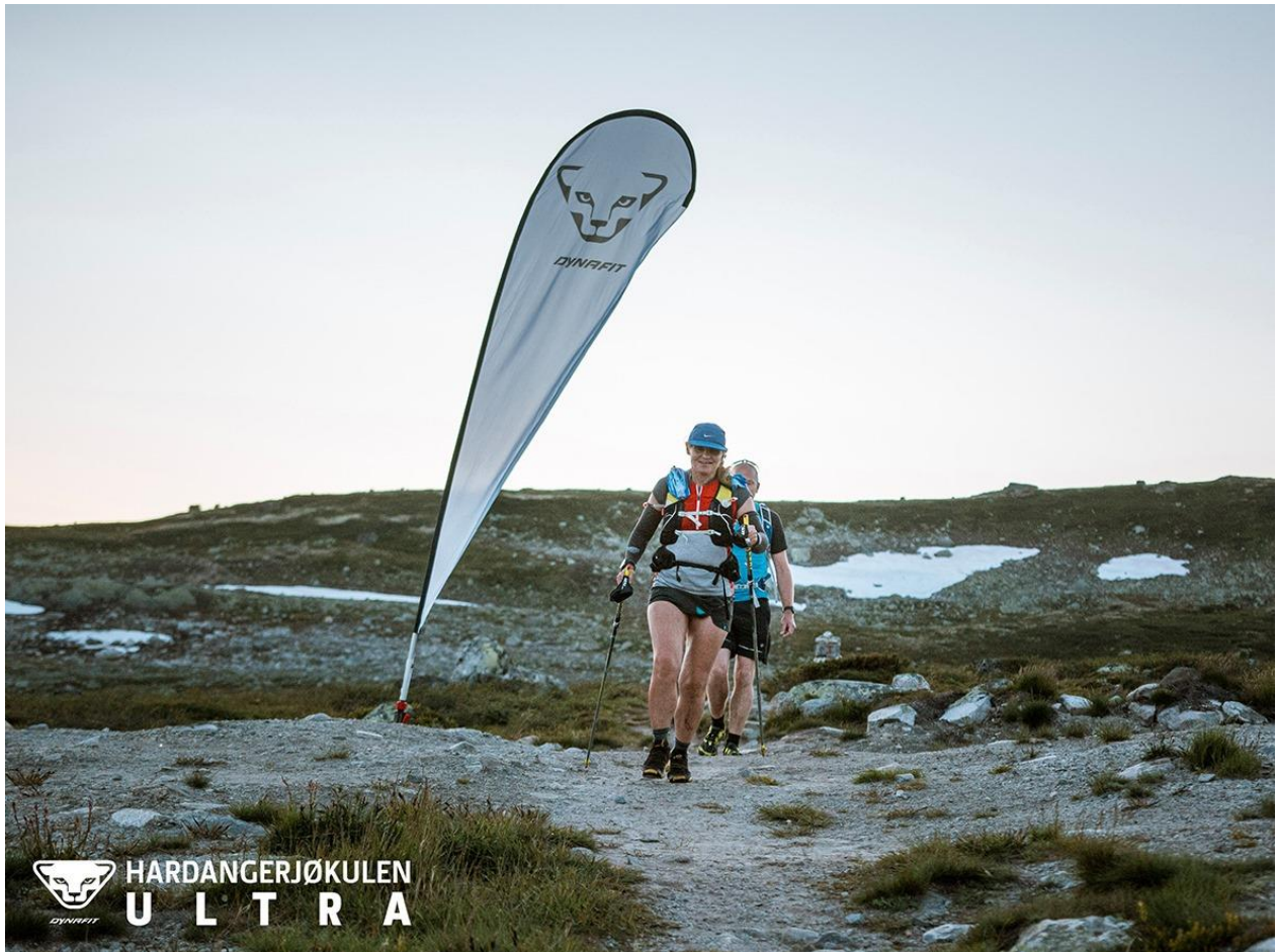
Bilde 1 Fra Dynafit Hardangerjøkulen Ultra 95k